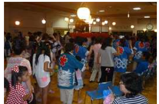
ラストは何重にも輪ができた総踊り

今年も施設ご利用者のご家族様、地域の方々などたくさんご来場いただき、なんと 230 名もの方にご参加いただきました。最後の総踊りでは、やぐらを囲んで何重にも踊りの輪ができ、炭坑節のアンコールがかかるほどの大変な盛り上がりでした。