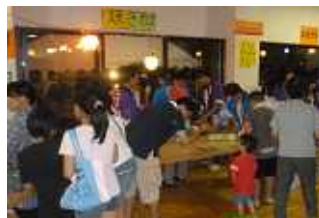
焼きそば、かき氷などの屋台に行列ができました。