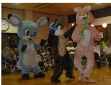
ベルディたちの登場に大盛り上がり!