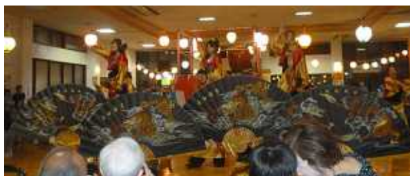
舞來瞳様の迫力満点の踊り! 大きな扇子や旗を使い、とても 華やか。