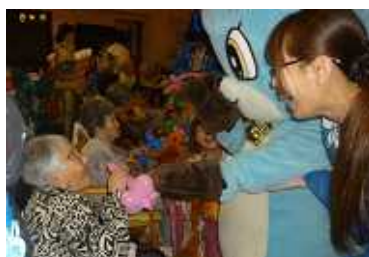
バルーンアートを配ります