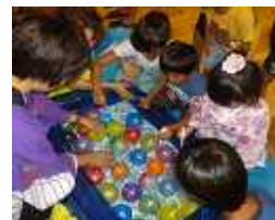
ヨーヨー釣りも 大人気!